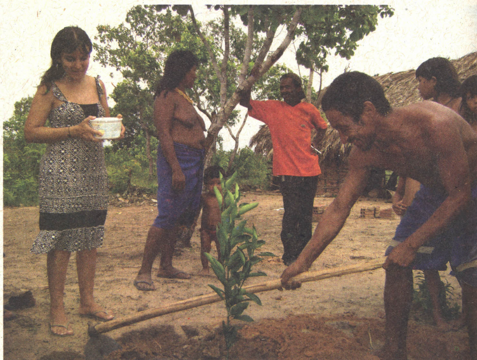
Figura 2. Enriquecimento de quintais, indígenas com 20 mil mudas de fruteiras.

Localmente, uma rede de agricultores guardiões mantém variedades pela prática da agricultura tradicional. Segundo Dias et al. (2008a), um estudo para compor o calendário de cultivos deste povo relacionou espécies e variedades mantidas pelo banto local de sementes: 20 variedades de arroz ( Oriza sativa ), 15 de fava ( Phaseolus lunatus ), 15 de inhame ( Colocasia spp. ), 13 de batata-doce ( Ipomoea batatas ), 13 de mandioca ( Manioc esculenta ), 10 de macaxeira ( Manioc esculenta ), 10 de milho ( Zea mays ), 6 de feijão ( Phaseolus vulgaris ), 5 de andu ( Cajanus cajan ), 11 de abóbora ( Cucurbita pepo ) e 3 de moranga ( Cucurbita maxima ).