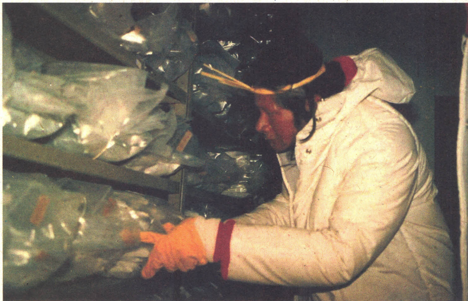
Figura 1. Busca de variedades tradicionais de milho (chamadas pelos Krahô de pohumpey ) nas câmaras de conservação (Colbase) da Embrapa Recursos Genéticos e Biotecnologia (Cenargen) (interação conservação ex situ e in situ/on farm ).