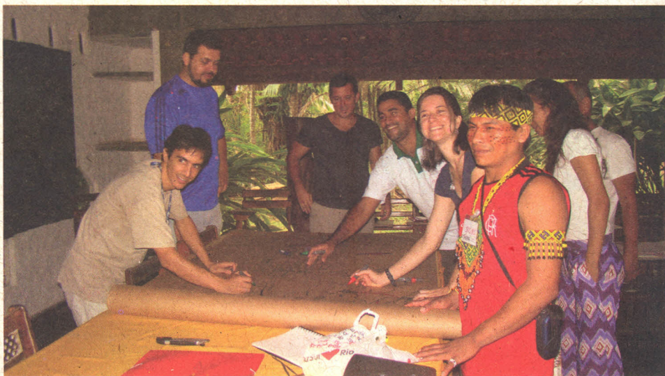
Figura 12. Oficina de nivelamento e metodologia participativa na Comissão Pró-Índio do Acre.