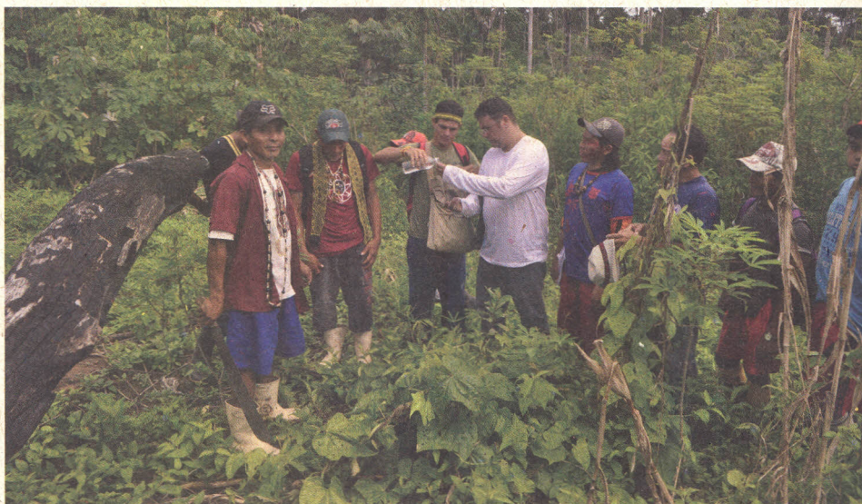
Figura 14. Levantamento e manejo de insetos considerados problema pelos Kaxinawá.