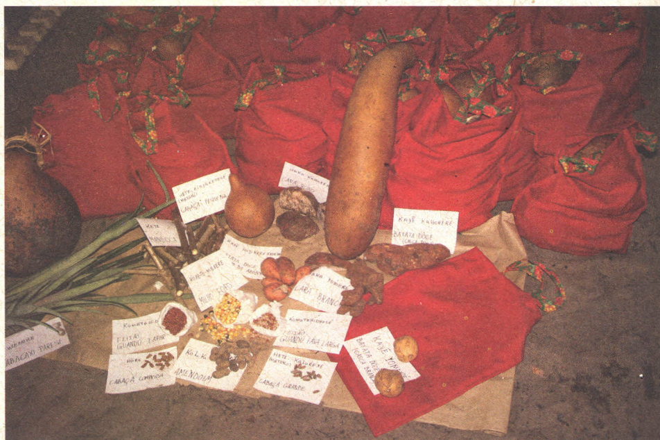
Figura 5. Feira de sementes realizada pelo povo Paresi, MT, na aldeia Paraíso.