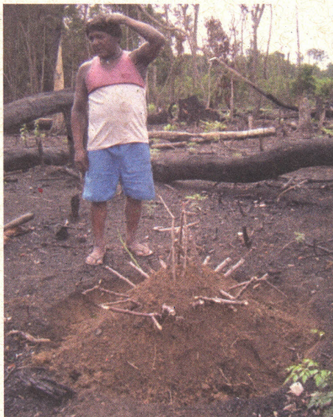
Figura 8. Índio Waurá em frente a um monte de mandioca (prática de conservação local chamada “casa do espírito dono da mandioca”).

relaciona ao plantio de diversas variedades de mandioca. A proximidade favorece cruzamentos intervarietais, gerando novas combinações que posteriormente podem ser selecionadas pelo agricultor.