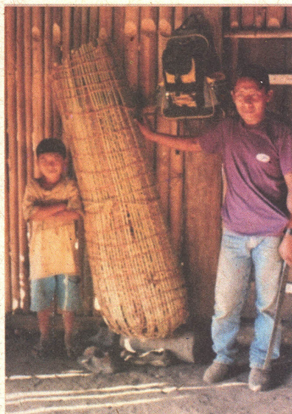
Figura 7. Método tradicional de conservação do milho.