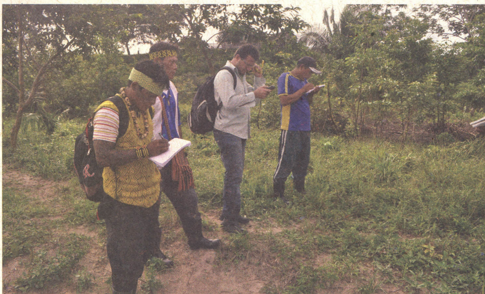
Figura 13. Caracterização, introdução e diversificação de produção de fruteiras.